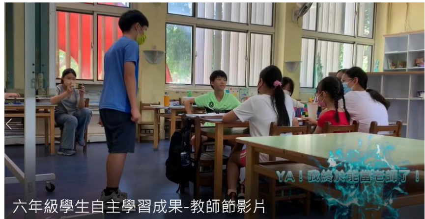
六年級學生自主學習成果-教師節影片