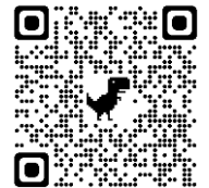
大理 e 酷幣