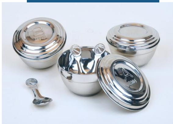
不鏽鋼餐碗、 蓋、湯匙