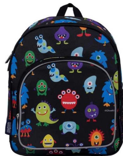
書包 (可放A4 大小)