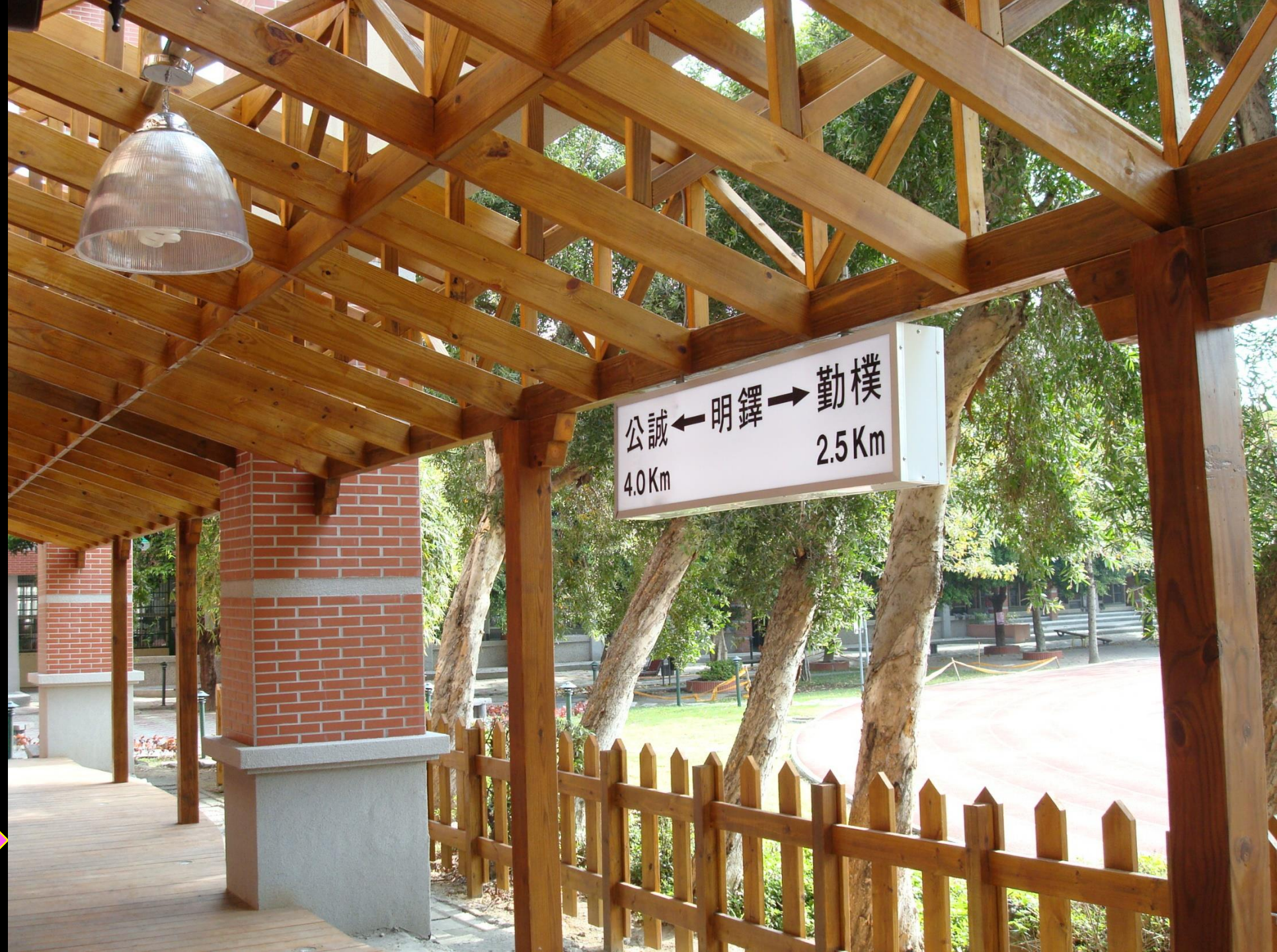
鐵道意象 - 明鐸月台