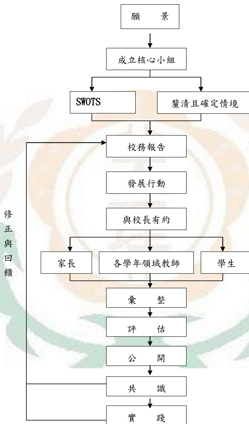
圖三-2 課程願景實踐流程