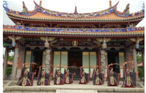
古禮祭典「雅樂舞」精采畫面

臺北市孔廟歷史城區自民國99年10月12日起至民國100年7月23日推出國際觀光再生計畫，舉辦「舞動儒風-古禮祭典·儒家風格展演與體驗」系列活動，誠摯的邀請各位朋友前往觀賞，也歡迎各學校、機關、旅行團體免費預約報名體驗！